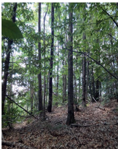
Forêt de châtaigniers à Saint-Laurent de Cerdans