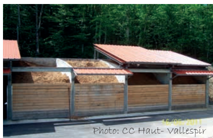
Hangar de stockage à Saint-Laurent de Cerdans

Rythme d'approvisionnement : 2 fois par an