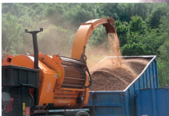
Broyage chantier Saint-Laurent de Cerdans