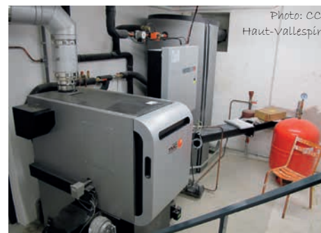
FRÖLING, 35 kW

Mise en service : 05 avril 2011 Chaudière : FRÖLING Puissance : 35 kW Décendrage : Automatique voie sèche Temps passé pour l'entretien : 1h30 par semaine (surveillance, nettoyage, évacuation bac à cendres, suivi administratif)