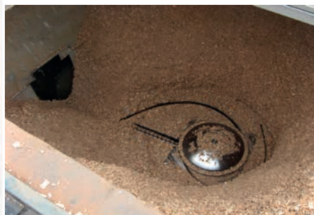
Extracteur rotatif à lames souples