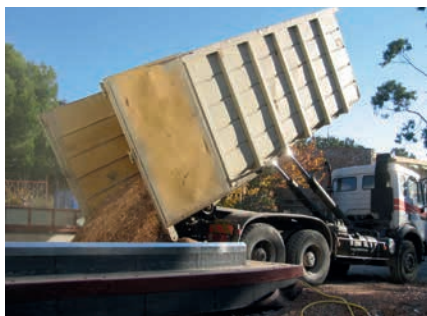
Remplissage du silo