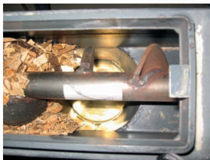
Vis sans fin