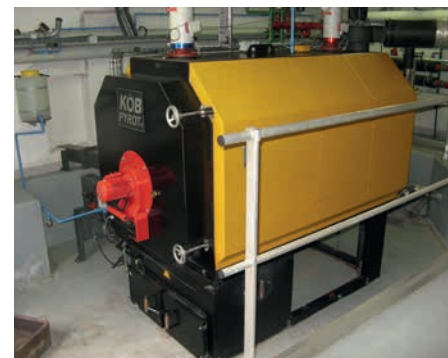
Chaudière Köb Pyrot, 220 kW